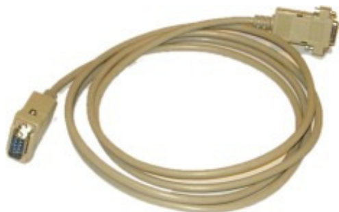
2 kable RS232 (DB9) do połączenia z komputerem i systemem POS