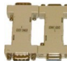
2 przejściówki DB9