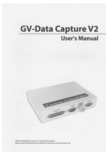
Podręcznik użytkownika w wersji ang.