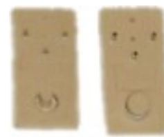
2 mocowania ścienne