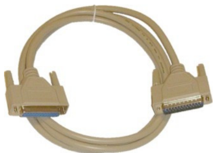
Kabel RS232 (DB25) do połączenia z drukarką