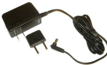
Zasilacz 5V, 2000 mA