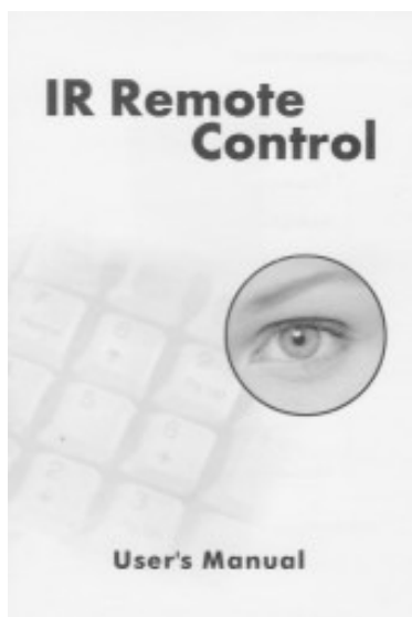
Podręcznik użytkownika w wersji angielskiej