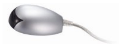
Odbiornik podłączany do portu USB komputera